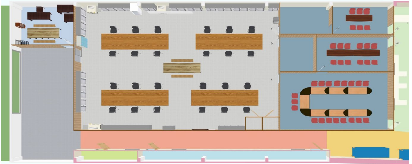
圖 1：發表會場地 => 示意圖 與 現場實際照片